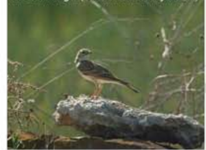
Terrerola vulgar ( Calandrella brachydactyla )

En els ambients oberts i de conreus són comuns els mamífers com el talpó comú (espècie de costums subterrànies que es troba generalment als terrenys d'aufals), i la mussaranya comuna. Entre els rèptils destaca la serp blanca.