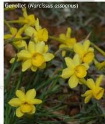
Genollet ( Narcissus assoanus )

Al llarg d'aquesta ruta es va repetint una seqüència de comunitats vegetals corresponent a la alternança de solell, carena i obaga que es va trobant en alternar turons rocosos i feixes de conreu de cereal.